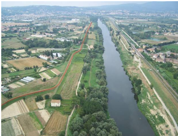
Una veduta aerea dell'Arno con il tracciato del percorso tratteggiato in rosso

In conclusione, molteplici sono i vantaggi di questa nuova pista pedo-ciclabile sull'Arno: oltre all'evidente contributo alla sostenibilità ambientale e al potenziamento della rete degli spostamenti urbani ed extraurbani, la realizzazione di questi itinerari lungo il fiume, contribuisce alla riqualificazione e alla promozione del paesaggio e svolge una funzione di pista di servizio per il monitoraggio e la manutenzione delle opere idrauliche .