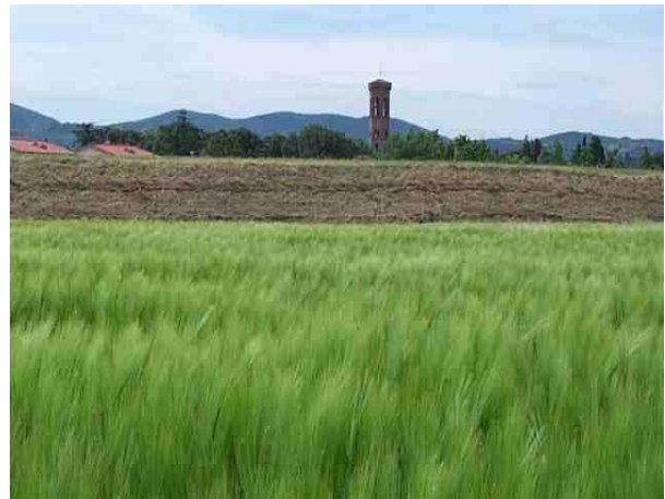
I percorsi lungo i fiumi servono al Consorzio, ai cittadini e magari anche ai turisti.