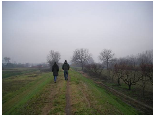
Lo stato attuale dell'argine in riva sinistra d'Arno nel tratto nel comune di Scandicci